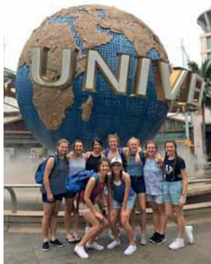
Die 0/15-span by Universal Studios.