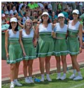
Interhuisatletiekfoto's deur Suné du Preez