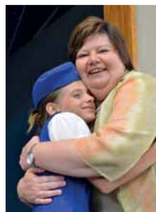
Ons kleinste Affie word gekroon.

Die bekroning van hulle tyd in die oseaan het later tydens die ope-lugkonsert en 'n keppiekroning onder die sterre plaasgevind. Die blou golf is nou ook hulle s'n om te ry, want vis of vlees, Affies is die bloudruk vir die lewe!